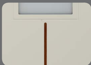
Ton Bois doré