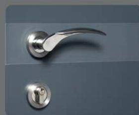
Poignée standard Ancre