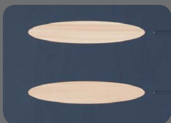
Ton Bois clair

Inserts ALU intégrés pour un design élégant (côté extérieur uniquement)