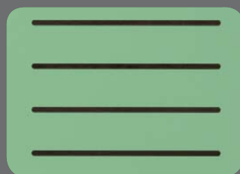
Ton Bois foncé